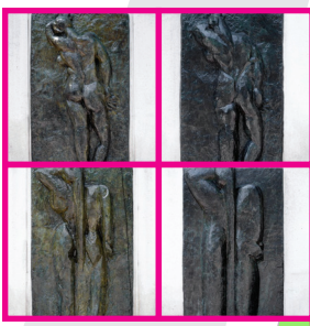
11 Henri Matisse, Backs I-IV [Espaldas I-IV]